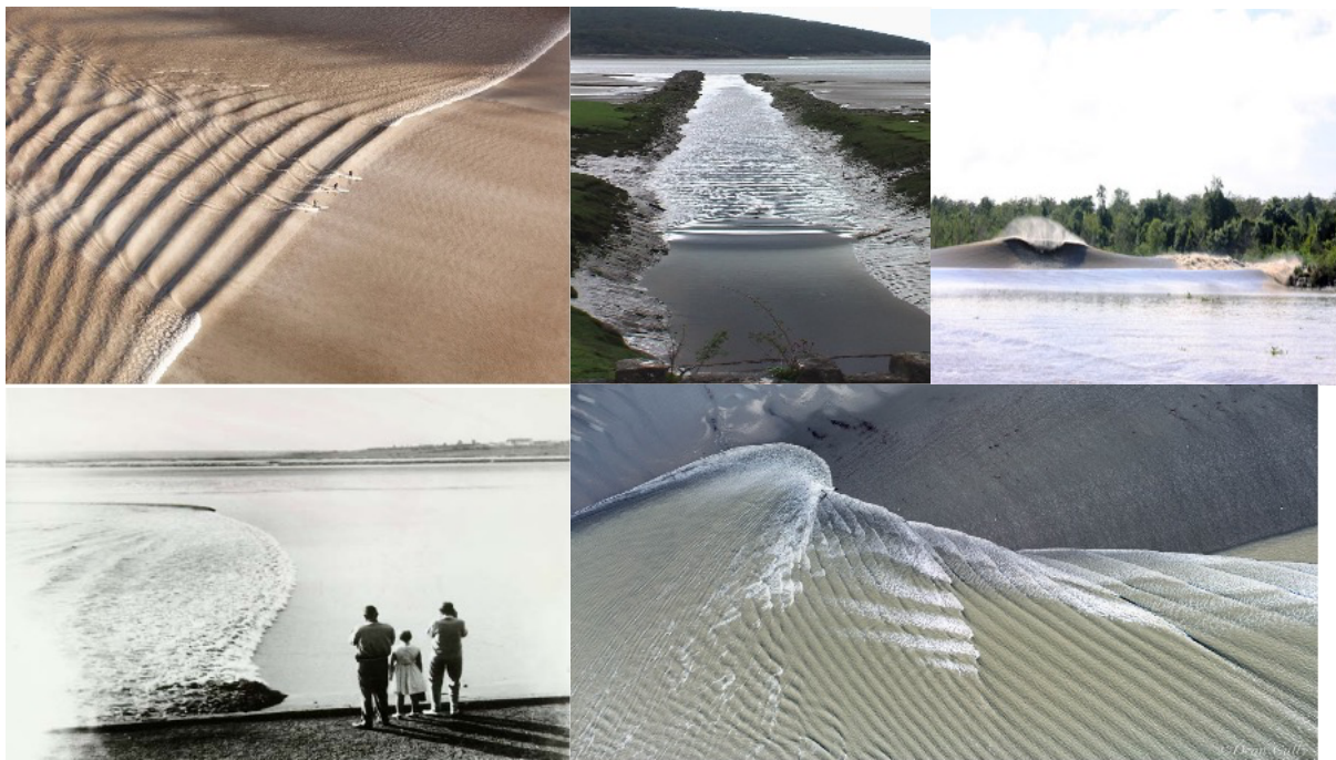
Figure 1 : Effet de la bathymétrie sur la propagation d'une barre de flot. Profondeur variable ; effet de berge ; bosse centrale ; mascaret ; superposition de fronts d'onde après propagations différentielles.

La barre de flot consiste en l'onde de marée qui remonte le cours d'un fleuve en la barrant et ce pendant une phase de marnage (flot) importante. Dans sa forme simple, elle est caractérisée par un front principal et des ondulations secondaires (êteules). Pour des conditions plus rigoureuses, elle devient déferlante. La bathymétrie a une importance cruciale non seulement sur le type de barre de flot mais aussi sur sa vitesse d'avancée : par exemple, des berges inclinées génèrent un jet de rive turbide, le rat noir ou mascaret en gascon ; de même, des variations de profondeur induisent une transition latérale ondulante-déferlante de la barre de flot (cf. Figure 1) ; une variation longitudinale de la profondeur comme un banc de sable peut stopper l'onde de marée et ou provoquer une réflexion partielle et des figures d'interférences ou bien alors un îlot central qui vient couper la barre dont chaque partie peut se propager dans des chenaux avec des caractéristiques différentes (pentes, hauts-fonds, vitesses des courants, formes et constitutions des berges...). Nous avons découvert par